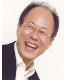
仲畑 貴志 (コピーライター)

数々の広告キャンペーンを手掛け、カンヌ国際広告映画祭金賞・TCC賞、ADC賞、他多数受賞。